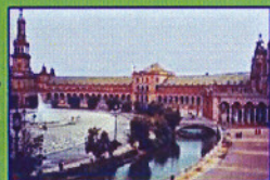
ANIBAL GONZALEZ (EXPOSICION DEL 29)