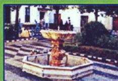
DON JUAN TENORIO (BARRIO DE SANTA CRUZ)