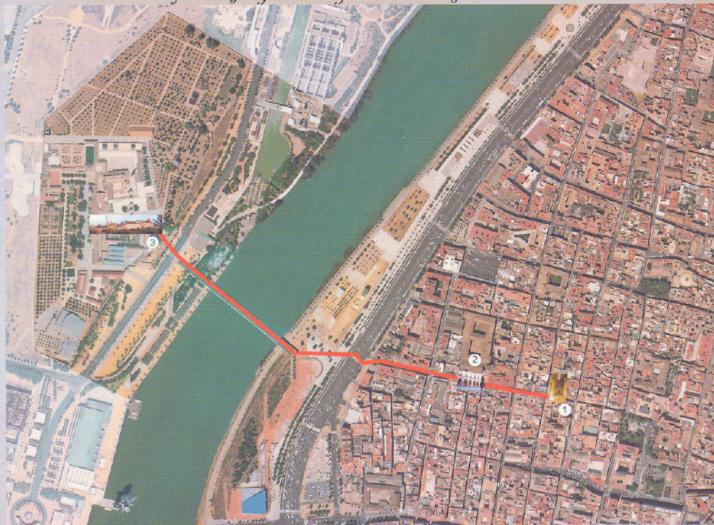
1- Baños de la Reina Mora

Concedido a la reina Juana la Loca se conserva parcialmente, segregado y utilizado como convento, se localiza al norte del edificio el apodyterium cuyos muros se adaptan a la línea actual de la calle Baños.