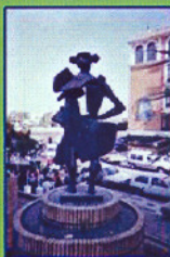
JUAN BELMONTE (LA MAESTRANZA-TRIANA)