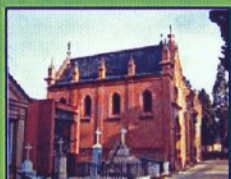
GUSTAVO ADOLFO BECQUER (CEMENTERIO DE SAN FERNANDO)