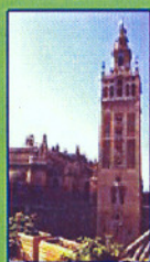
CRISTOBAL COLÓN (CENTRO HISTÓRICO)