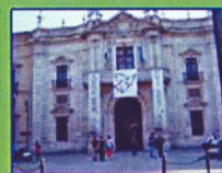
MAESE RODRÍGUEZ DE SAN- TAELLA (PRADO DE SAN SE- BASTIAN-CENTRO)