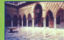
DOÑA MARÍA CORONEL (SAN PEDRO)